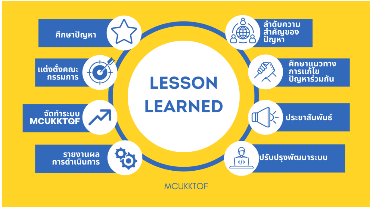
แผนภาพที่ ๒ : การถอดบทเรียน (Lesson Learned)